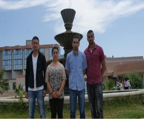
Candidats retenus dans le cadre du Programme BATTUTA