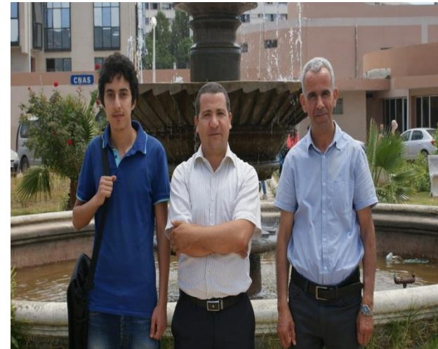
Candidats retenus dans le cadre du Programme UnetBA