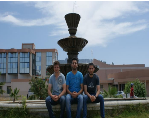
Etudiants retenus dans le cadre du Programme FATIMA AL FIHRI