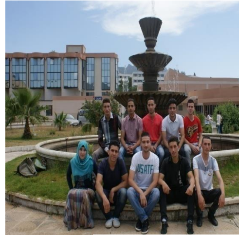
Candidats retenus dans le cadre du Programme Green IT